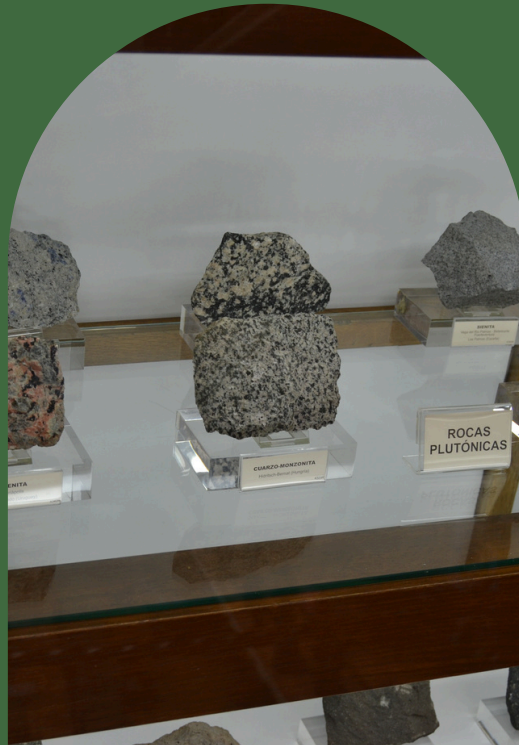
SALIDA DEL TALLER DE MEDIO AMBIENTE